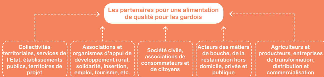
Figure 1 : Les partenaires pour une alimentation de qualité pour les gardois, selon la Charte d'engagement

Dans les faits, elle est non coercitive. L'émergence de politiques communes reposant sur un processus de long-terme, son intérêt premier est d'accélérer la mise en réseau.